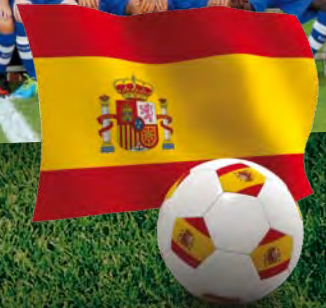
LE FC MALAGA