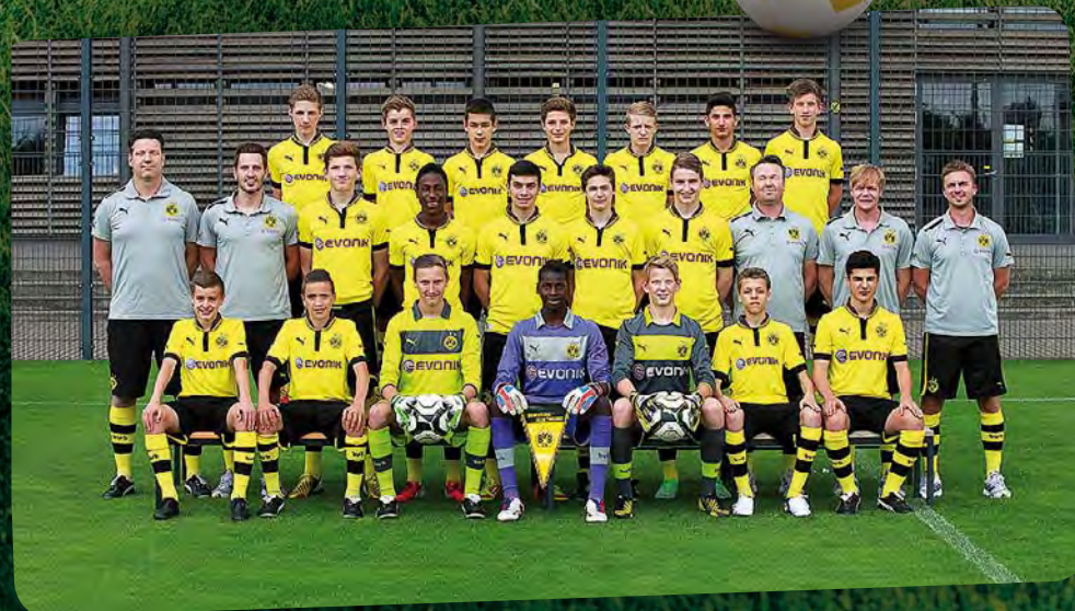
LE BORUSSIA DORTMUND