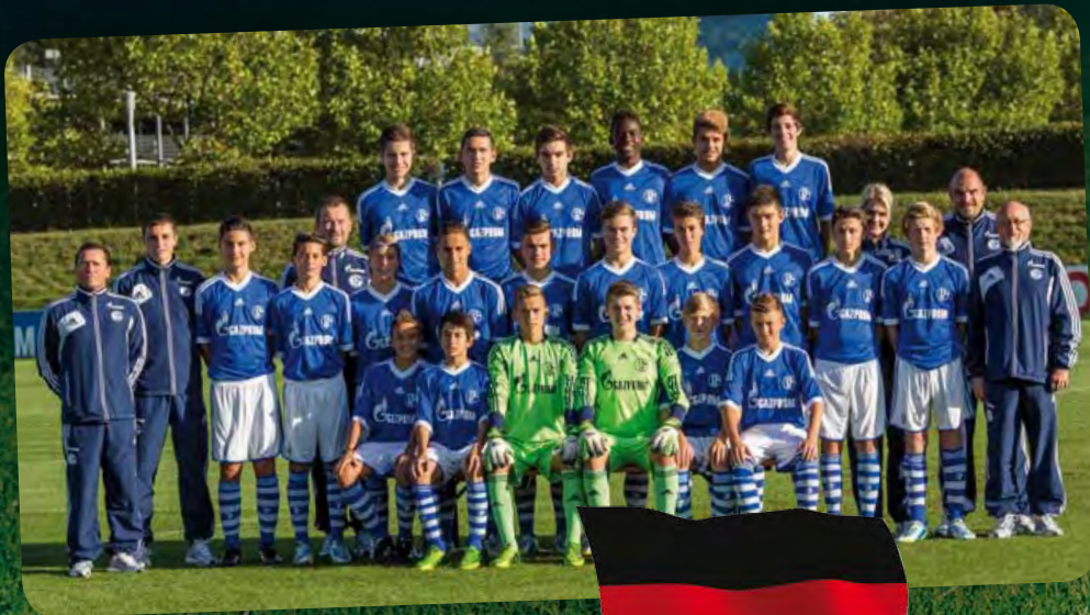
LE SCHALKE 04