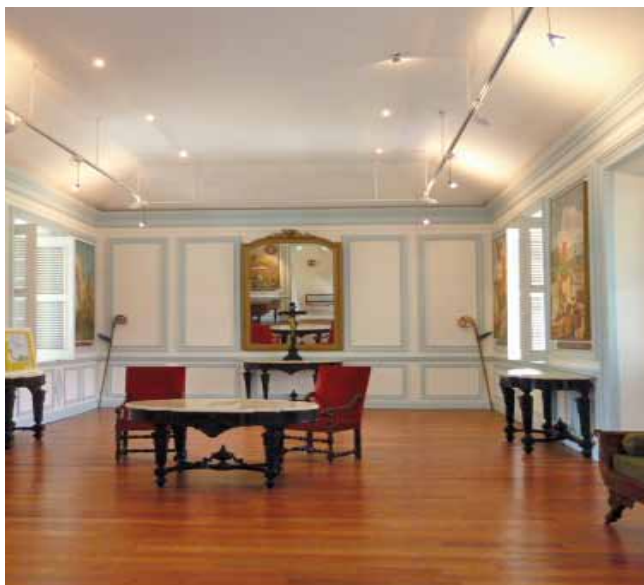
Bâtiments du XIX e siècle organisés autour d'un patio agrémenté d'un jardin et d'une fontaine.

Place Saint-François 0590 81 36 69 catholiquement-guadeloupe.org