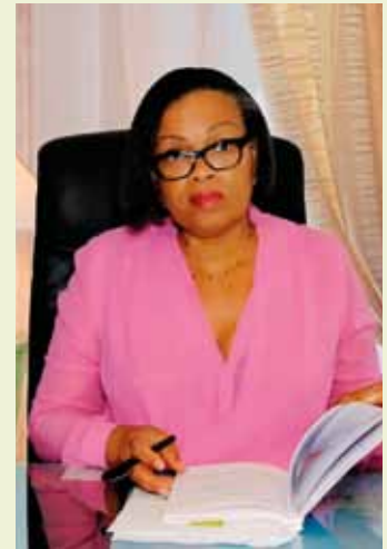
Aurélie Filippetti Ministre de la Culture et de la Communication

Cette année apparaît comme une année importante pour le patrimoine Guadeloupéen. En 2013, la trentième édition des Journées Européennes du Patrimoine fête les 100 ans de la loi instituant les Monuments Historiques.